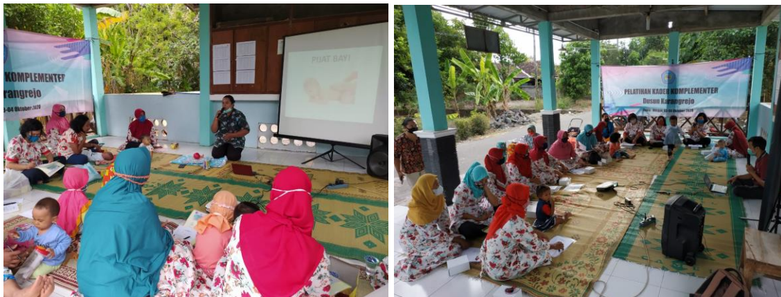
Gambar.2 Pelatihan Kader Komplementer

elayanan kesehatan. Oleh sebab itu peningkatan pengetahuan keterampilan dari kader sangat diperlukan untuk mendukung program kesehatan (Dinkes, 2018, Utami, 2011, Subagyo, 2010). Demikian halnya dengan program kampung komplementer, peran kader sangat penting sehingga tim pengabdian memberikan pelatihan kader komplementer. Pelatihan kader komplementer ini dibagi 2 kelompok yaitu kelompok 1 (hari pertama) sebanyak 9 orang dan kelompok 2 (hari kedua) sebanyak 16 orang. Materi pelatihan hari pertama yaitu pijat bayi, makanan pendamping ASI lokal dan ASI booster alami. Sedangkan materi pelatihan hari kedua yaitu bekam, accupoint dan terapi herbal.