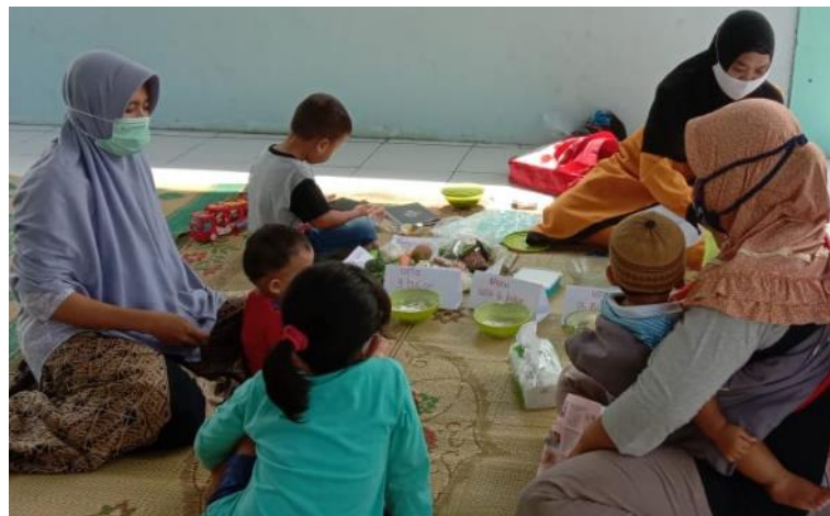
Gambar 5. Penyuluhan dan Praktik Pemberian Makan Bayi dan Anak (PMBA)

Kegiatan ini dilaksanakan pada tanggal 18 Oktober 2020 bersamaan dengan kegiatan posyandu Dusun Karangrejo. Gerakan makanan sehat bagi bayi dan balita diawali dengan penyuluhan dan praktik membuat makanan sehat 4 bintang sesuai rekomendasi World Health Organization (WHO). Penyuluhan kesehatan merupakan salah satu cara untuk menambah pengetahuan dan kemampuan individu atau kelompok melalui pembelajaran (Kemenkes RI, 2011). Tujuan penyuluhan adalah untuk mengubah atau mempengaruhi perilaku responden agar lebih mandiri untuk mencapai hidup sehat.