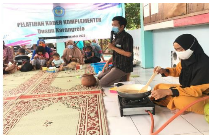
Gambar 6. Penyuluhan Pemanfaatan Herbal untuk Kesehatan

Mayoritas penduduk belum mengetahui cara pengolahan tanaman herbal untuk mengatasi masalah kesehatan ringan yang dialami. Kondisi ini juga ditunjukkan oleh Agil et al (2018) yang menunjukkan lebih dari 50% peserta pelatihan pengolahan ramuan obat di Desa Wajik, Kabupaten Lamongan Jawa Timur belum mengetahui cara pengolahan pasca panen tanaman obat dan ramuan tanaman obat untuk kesehatan wanita.