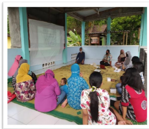
Gambar 1. Sosialisasi, Pemilihan Pengurus dan Kader Kampung Komplementer

Pengelolaan kampung komplementer memerlukan pengurus yang disepakati masyarakat, maka pada awal kegiatan dibentuk pengurus kampung komplementer pada hari Sabtu, 26 September 2020 yang terdiri dari Ketua, Sekretaris dan Bendahara